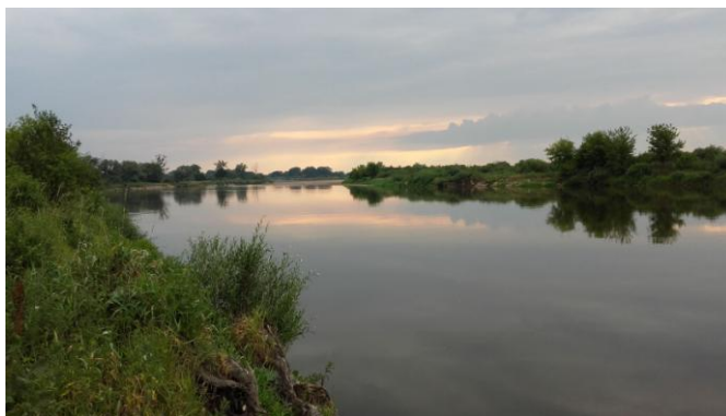
Nad Bugiem

16.00-17.00 OBIAD, ZAKOŃCZENIE KONFERENCJI